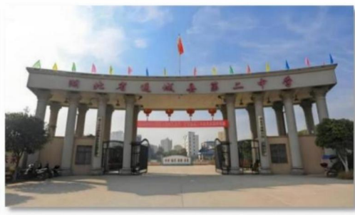
通城县第二高级中学

行稳，方能致远；蓄力，方可薄发。第二个月的沉淀，是我们为未来教师生涯锻造的最坚实的铠甲；第二个月的静水深流，积蓄了我们破浪前行的力量。“为未知而教，为未来而学”愿我们永怀这份滚烫的热忱，以梦为马，不负韶华，在教育的星辰大海中，乘风破浪，光芒万丈！