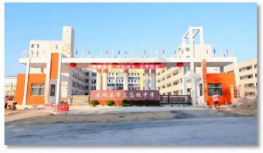
通城县第三高级中学