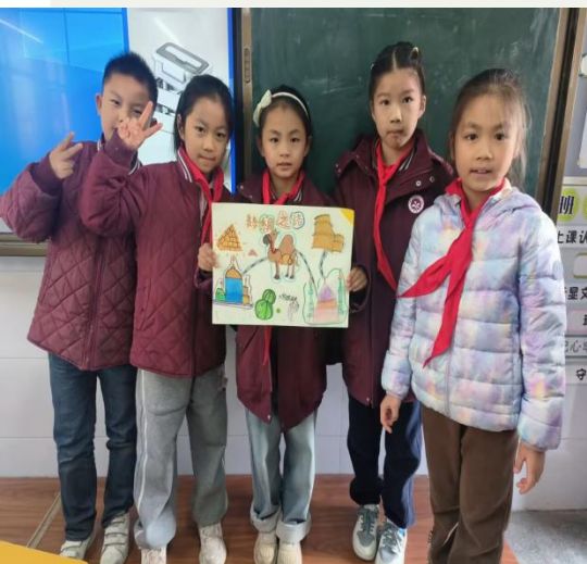
美术授课

上完《丝路的故事》这堂小学三年级美术课，我在教学方面收获良多，也对小学美术教学有了更真切的感悟。首先，我借助AI机器人小星的虚拟情境、小组竞赛形式，以调动学生的参与热情。学生在角色扮演和任务驱动中，能够主动观察丝路建筑、梳理丝路元素。这比传统讲授式教学的课堂参与度高出很多，也让我体会到小学美术教学中“趣味化情境”是撬动学生学习主动性的关键。课上，我进行了跨学科融合，将丝路的历史文化、地理知识与美术创作结合，学生在画丝路线路图、设计丝路元素时，不仅锻炼了绘画技能，还加深了对丝路文化的理解。小学美术课不只是教绘画技巧，更能成为文化传承的载体，实现“以美育人”的核心目标。