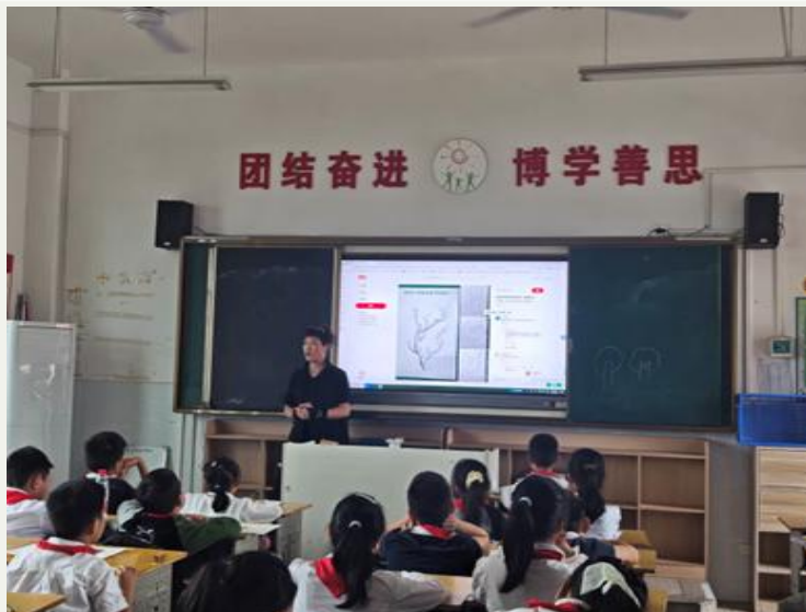
美术授课