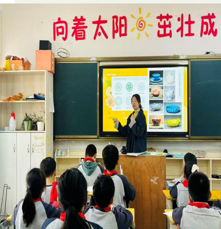
美术授课

结合三年级学生具象思维活跃、动手欲强的特点，设计多元课程，兼顾基础技法传授与创作兴趣激发。