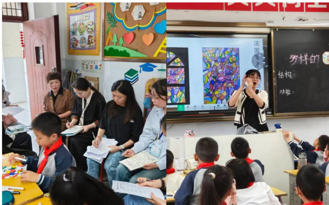
美术授课

观摩优秀教师的课堂，是一扇“示范之窗”。从严谨细致的逻辑讲解到生动有趣的互动设计，从板书的巧妙布局到课堂突发情况的灵活应对，我们得以窥见成熟教学的精髓，收获了可落地的教学方法与技巧。