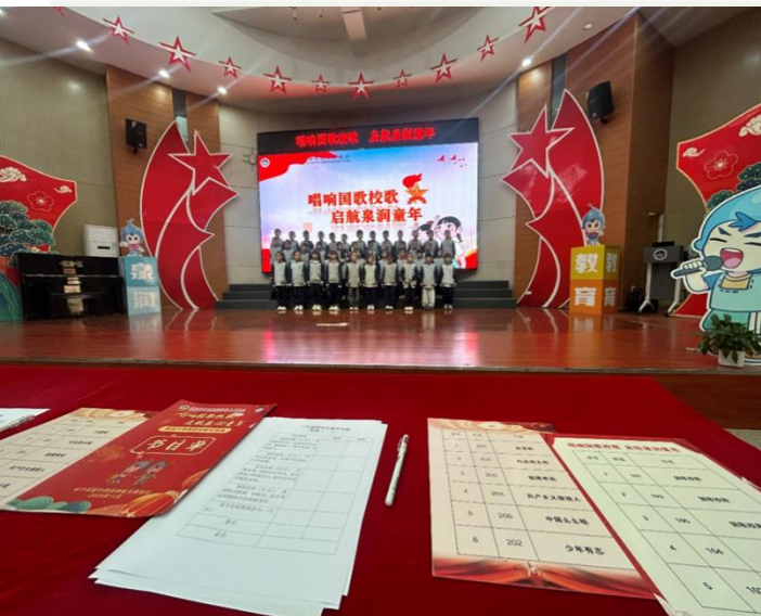
音乐授课