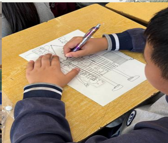
美术授课