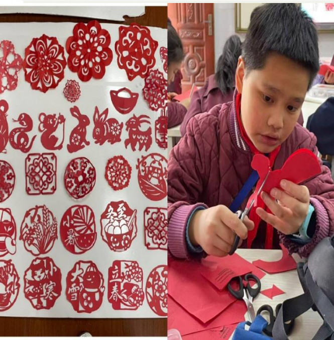
美术授课