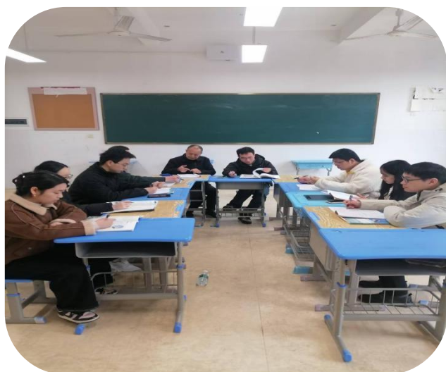
（嘉鱼第一初级中学）

为持续提升教学品质与育人成效，嘉鱼第一初级中学与嘉鱼第二中学近日分别组织开展面向实习教师的专题教研活动。两校通过系统化的教学指导、课堂观摩与互动研讨，助力实习教师深入理解教学实际、掌握课堂管理方法、提升教学设计能力，为其专业成长奠定了扎实基础。此次系列活动不仅有效促进了实习教师教学水平的显著提高，也为两校实习教师的可持续发展注入了新的活力。