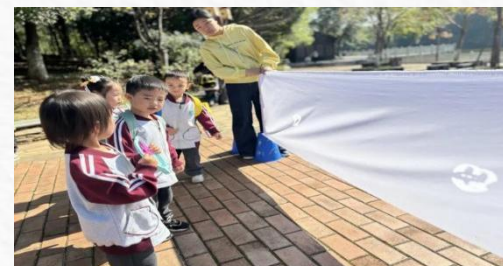
小六班：《一起“趣”追风》

风藏在哪里？它有颜色吗？瞧，小六班的小朋友们找到“风”啦，他们把风“捉”进了袋子里，跟“风”玩起了游戏。看！只要奔跑的速度够快，袋子就会像风筝一样飞起来。