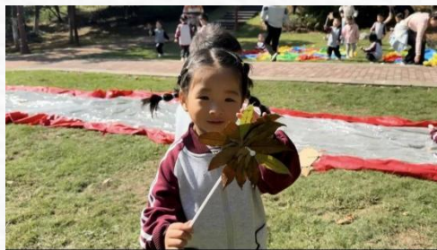
小五班：《有趣的影子》

伴着秋日的暖阳，小五班的小朋友们在阳光下尽情和影子嬉戏，找影子、踩影子...玩得不亦乐乎！咦，这个闪亮的小光点是从哪里来的？哦，原来是镜子和阳光在玩游戏，我们一起来试试吧！