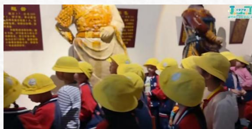
景点 3: 三国雕塑园

雕塑园里有许多三国人物：孙权、庞统、赵云、诸葛亮等。幼儿们都跟自己喜欢的三国人物照了像。