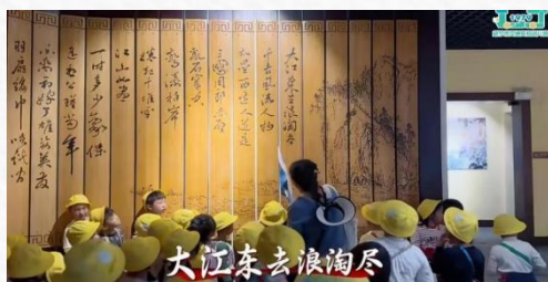
景点 2: 赤壁大战陈列馆

雕塑园里有许多三国人物：孙权、庞统、赵云、诸葛亮等。幼儿们都跟自己喜欢的三国人物照了像。