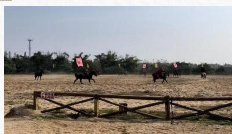
景点 1: 跑马场