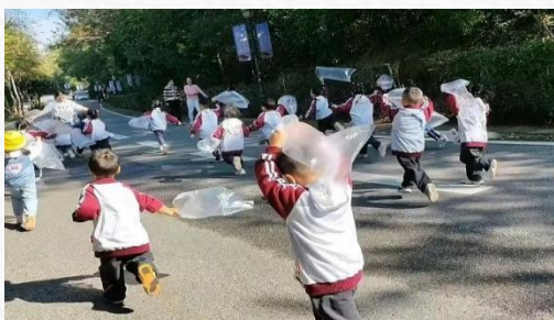
小七班：《大自然的泡泡机》

哈哈，大自然的泡泡机来喽！瞧，我的树叶泡泡机，吹出来的泡泡在阳光的照射下都是彩色的。咦，我用树枝做的泡泡机，吹出来的泡泡怎么跟你的一样，都是圆圆的？