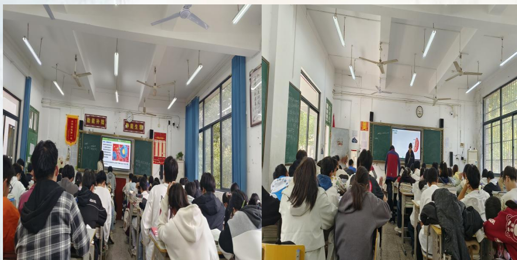
(通讯员：核技术与化学生物学院 王德琼)