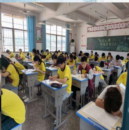
(通讯员:电子与信息工程学院 程魏黄)