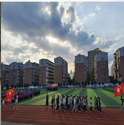
（通讯员：教育学院 张雨珊）

通山县实验初中： 绿操场被攒动的人影铺满时，课间操的音乐刚好漫过风。我站在队伍旁，看小小的扇子跟着节拍“唰”地展开——红的、粉的扇面晃成一片轻云，连平时爱晃神的男生，也把胳膊抬得笔直，跟着节奏一收一展。阳光落在他们仰起的脸上，连整齐的动作里，都裹着少年人的鲜活动儿。跳绳的绳影在地面织成网时，操场的角落也热闹起来。绳圈打在脚踝上的轻响，混着喘气声，成了课间最热闹的背景音。原来“锻炼”从不是枯燥的指令，是跳起来时，连风都跟着轻快的瞬间。