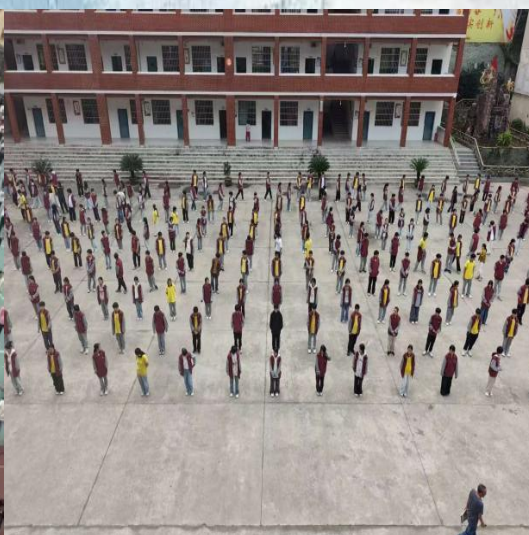
（通讯员：核技术与化学生物学院 李江峰）