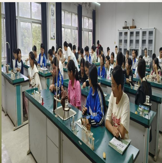
(通讯员：外国语学院 刘丹)

通山县实验初中： 笔尖摩挲纸张的沙沙声是教室最安静的“心跳”。监考时走过一排排课桌，撞见有的同学咬着笔杆皱眉头，有的把草稿纸写得密密麻麻，连趴在桌上打盹的少年也会忽然惊醒揉着眼睛补答题卡——青春的“较劲”，藏在每一道题的求解里。我轻放脚步，把这份专注悄悄收进实习的记忆里。实验室的导线与电表是少年们的“新玩具”。举着接线板的手碰在一起研究电路图的脑袋凑成小团，有人小声喊“哎！电表指针动了！”，惹得周围人都转头笑。我蹲在桌旁帮他们理清楚导线的正负，看着原本生疏的操作慢慢变得熟练，才懂“实践”两个字是亲手碰过才真正烙进心里的知识。