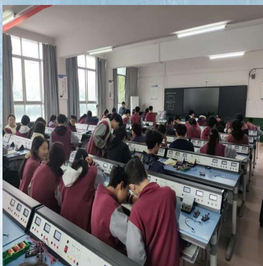
(通讯员:电子与信息工程学院 程魏黄)

通山县实验初中： 笔尖摩挲纸张的沙沙声是教室最安静的“心跳”。监考时走过一排排课桌，撞见有的同学咬着笔杆皱眉头，有的把草稿纸写得密密麻麻，连趴在桌上打盹的少年也会忽然惊醒揉着眼睛补答题卡——青春的“较劲”，藏在每一道题的求解里。我轻放脚步，把这份专注悄悄收进实习的记忆里。实验室的导线与电表是少年们的“新玩具”。举着接线板的手碰在一起研究电路图的脑袋凑成小团，有人小声喊“哎！电表指针动了！”，惹得周围人都转头笑。我蹲在桌旁帮他们理清楚导线的正负，看着原本生疏的操作慢慢变得熟练，才懂“实践”两个字是亲手碰过才真正烙进心里的知识。