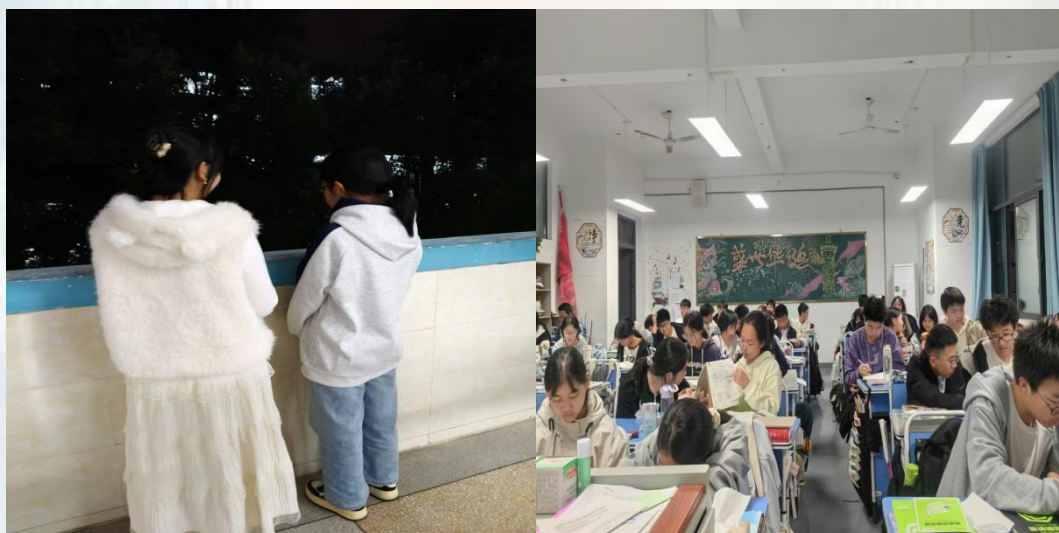
(通讯员：核技术与化学生物学院 王德琼)