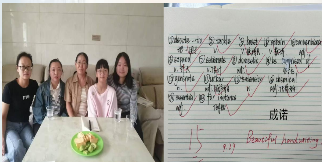
（通讯员：电子与信息工程学院 程魏黄） （通讯员：外国语学院 杜茜）