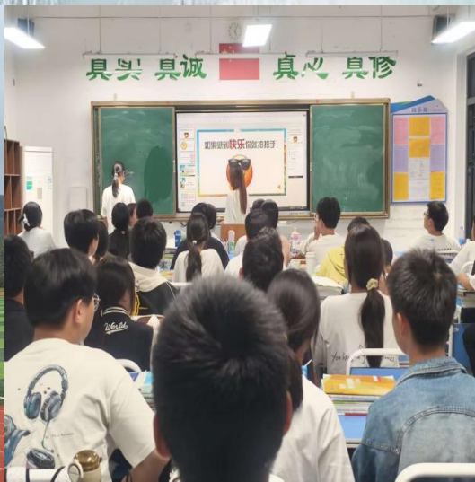
(通讯员：教育学院 李炳娥)

通山县第一中学： “纸上得来终觉浅，绝知此事要躬行！”在投身入课堂中我们才知道其中的困难。认真研究教材，力求准确把握重难点，并注重参阅各种资料，制定符合学生认知规律的教学方法。教案编写详细具体，从复习提问、新课引入到讲授都精心设计，并不断归纳借鉴优秀老师的经验。认真听取指导老师对我们的评价，改正我们在课堂上犯的错误。