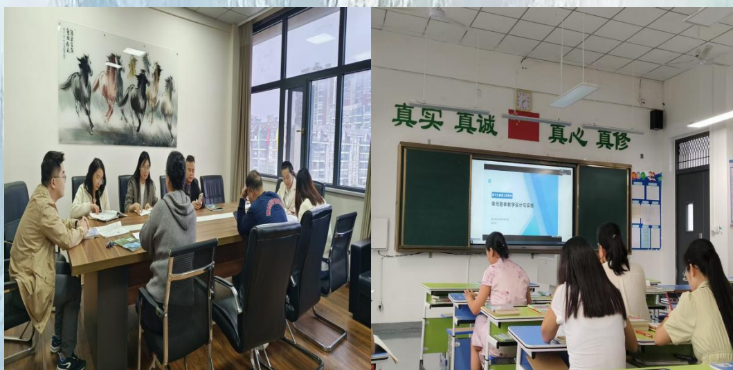
（通讯员：核技术与化学生物学院 王得琼）（通讯员：外国语学院 严琴）

教育的舞台，不仅限于三尺讲台之上的 40 分钟，更延伸至课下无数个精心准备的深夜，以及走进学生家庭、叩开心门的温暖旅程。实习生课下总是和老师们一起进行备课任务，为了设计一个能瞬间抓住学生注意力的课堂导入，他们会集思广益，从不同的专业视角提出创意每一份最终呈现在学生面前的教案，都经历了数次的修改与打磨。他们仔细推敲课堂上的每一句语言，精心设计每一页 PPT 的视觉效果，反复演练每一个教学环节的衔接。