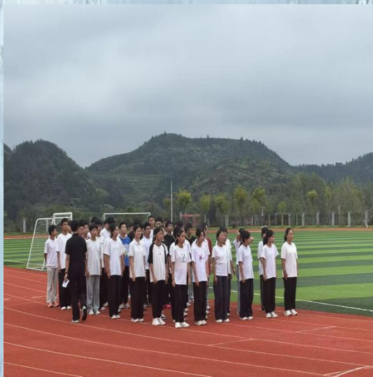
(通讯员：体育学院 王鹤程)

通山县实验高级中学： 从聆听者到讲授者，从学生到老师，身份的转变在一方讲台上完成。过去一个半月里，实习生们将理论化为实践。经过充分的听课与备课，我们实习老师陆续走上讲台，开始了人生的“第一课”。从最初的紧张生涩到后来的从容流畅，每一次板书、每一次提问、每一次与学生的互动，都是我们教学技能与信心的积累。我们努力将大学所学的理论与实际教学相结合，力求让课堂既生动又高效从文科的深情到理科的严谨，从艺术的陶冶到体育的飞扬，每一位实习老师都在用自己的方式，诠释着对“教育”二字的理解。