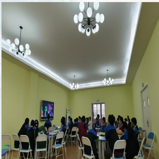
(通讯员：外国语学院 刘丹)