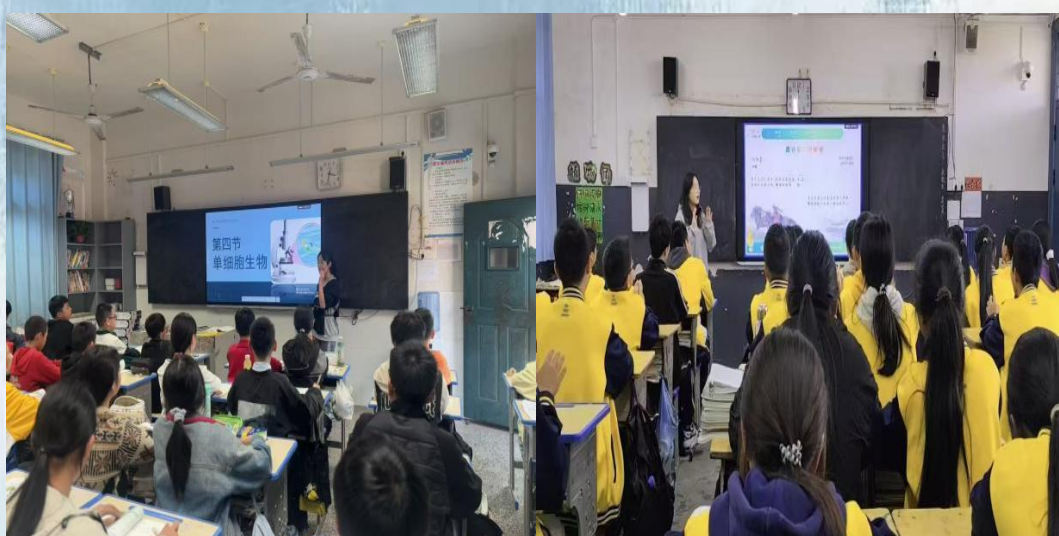
(通讯员：核技术与化学生物学院 许若秋)

通山县实验初中： “讲台是方寸，也是天地”——攥着教案的手心发紧，抬头撞见教室里一双双亮着的眼睛，忽然就稳了神。讲《单细胞生物》时，指着 PPT 上的显微镜图问“谁见过草履虫的‘小尾巴’？”，几只手“唰”地举过头顶；讲革命主题课时，说到“前辈们的脚印”，后排的男生悄悄坐直了肩膀。原来课堂的温度，是从“我讲”到“我们一起说”的瞬间。教室的光，分两种：一种是灯管落下来的亮，裹着课本与板书的墨香；一种是少年眼里的光，追着知识点跑，也藏着不肯输的劲儿。黄校服的衣角蹭过桌沿，笔尖划过纸面的声响，都在说“这节课，我们没走神”。