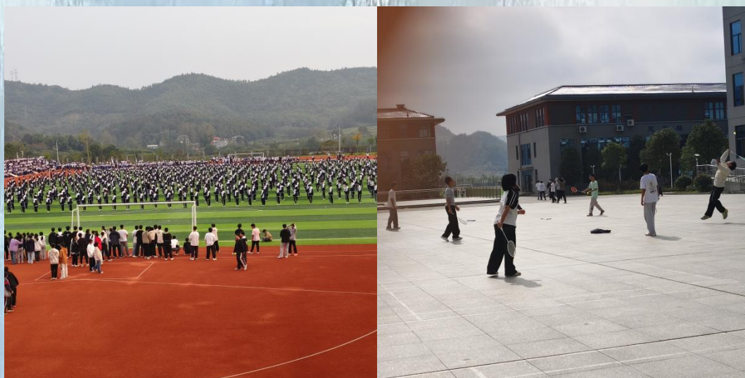
（通讯员：外国语学院 杜茜）

通山县实验高级中学： 当清脆的下课铃声划破校园的宁静，当每周期待的社团课时间到来，整个校园便瞬间切换至活力模式。这里是学生们释放天性、发展特长、凝聚班魂的舞台，青春的朝气在此刻展现得淋漓尽致。在丰富多彩的社团活动中，每一个学生都找到了属于自己的舞台。他们的才华在这里被看见，热情在这里被点燃，个性在这里被尊重和培养。这正是教育最美好的模样——让每一颗独特的星星，都能绽放出属于自己的光芒。