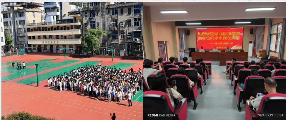
(通讯员：教育学院谢静文)