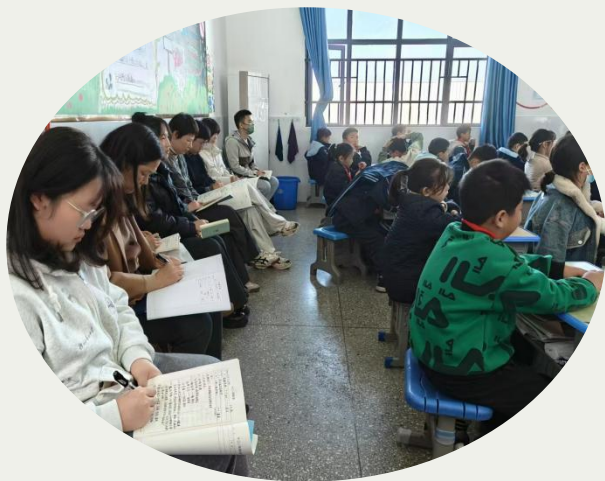
美术组集体听姜美老师示范课