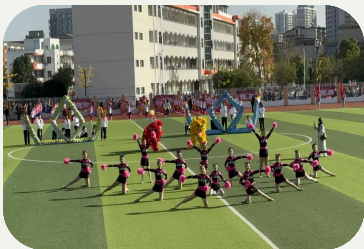
咸安区第十三届中学生运动会开幕式

文体并进，五育并举，在紧张的学习之余，泉都学校的体育训练也结出硕果。湖北科技学院体育专业实习生在湖北科技学院附属泉都学校担任实习老师期间，积极投身于体育建设之中，多位实习老师参与咸安区第十三届中学生运动会开幕式，两位实习老师以教练的身份带领田径队学生训练并参加咸宁市咸安区运动会，期间多位同学取得优异成绩。