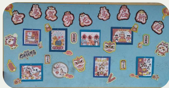
展览成品

新一年的暖意在校园流淌，这面展板以“金马贺岁，龙马启新程”为脉络，串联起传统年俗与青春热忱。当马年的意蕴与少年的朝气相逢，这份热闹里的期许，终将化为逐梦路上的星光。