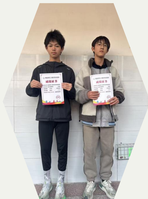
咸安区运动会获奖同学