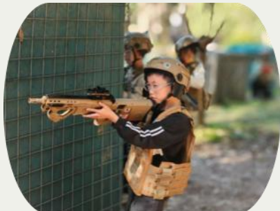
体验真人CS

课堂之外，天地即学堂。在研学实践中，同学们以行动探索世界的广度，以思考叩问知识的深度——头盔与仿真枪下，是战术协作时的专注眼神；锅碗瓢盆间，是亲手创造美味的温暖笑声；科技模型前，是凝视齿轮转动时闪烁的求知光芒。