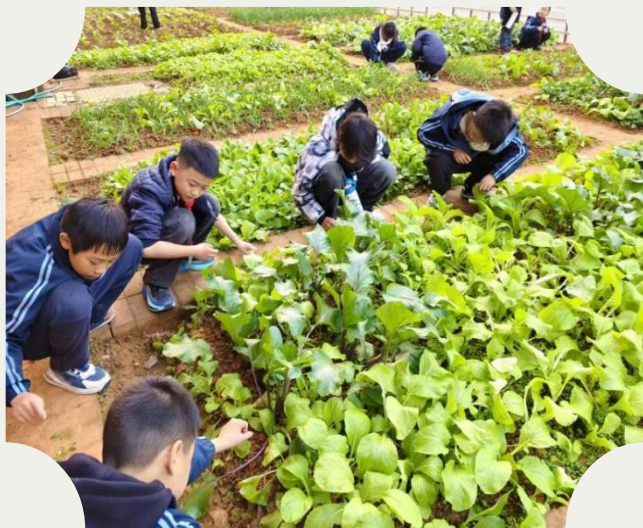
学生体验庄稼劳作

蹲在生机勃勃的菜畦间，指尖触碰的是鲜活的泥土。播种、观察、劳作，在汗水与期待中，我们体验着生命成长的完整周期。这片绿意不仅教会我们耐心与协作，更在提醒我们心灵也需一方接地气、有生命力的沃土。