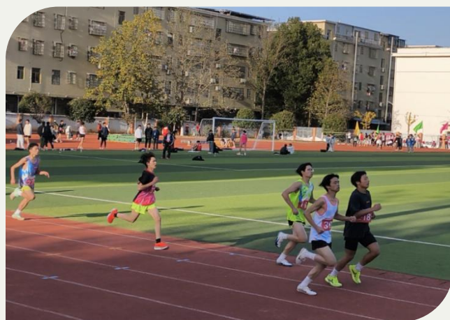
男子4×100、男子800米进行中