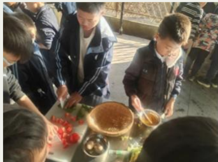
学生们集体做饭