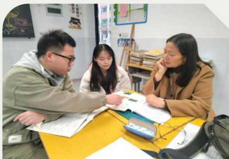
向老师及王老师进行地理评课