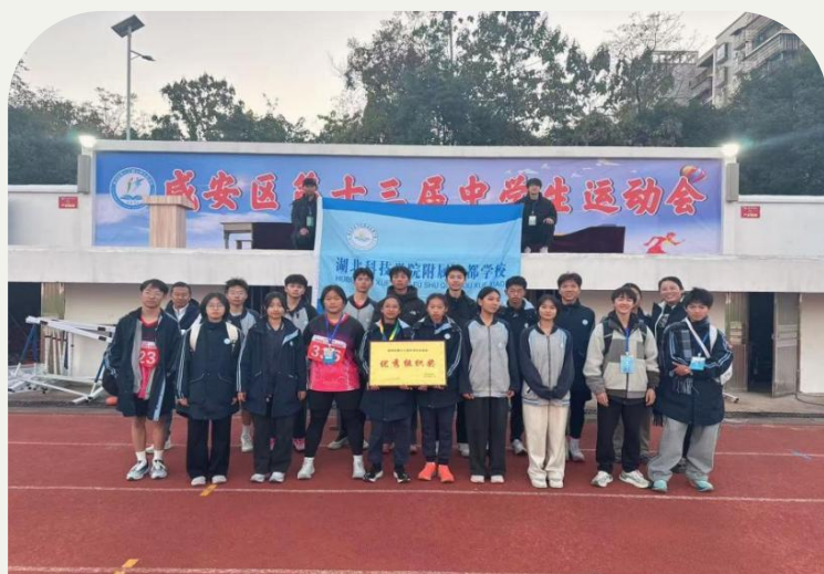
第十三届中学生运动会成员及教练

绿茵场上，学生们手持花球，以充满力量的舞姿绽放朝气；身后，老师们身披彩装舞动祥狮。从讲台到运动场，从师生到队友，每一次抬手、跃起，都是心与心碰撞的共鸣。这不仅是为运动会拉开序幕的暖场节目，更是一堂关于热爱、协作与传承的生动课堂。