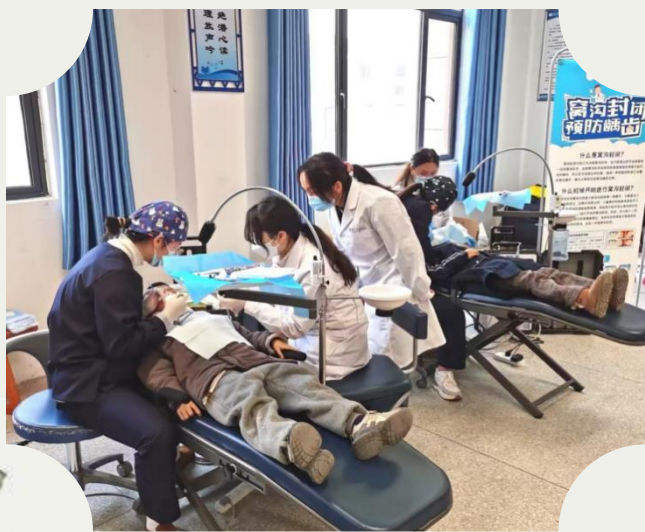
湖科口腔医院为孩子们洗牙

口腔健康是全身健康的基石，儿童时期的口腔护理更是关乎孩子一生的健康成长。泉都学校联合湖北科技学院附属医院口腔医院，开展了“窝沟封闭进校园”免费公益活动，用专业的呵护为孩子们的笑容保驾护航。