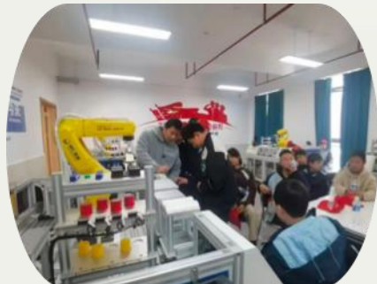
孩子们体验科技模型

口腔健康是全身健康的基石，儿童时期的口腔护理更是关乎孩子一生的健康成长。泉都学校联合湖北科技学院附属医院口腔医院，开展了“窝沟封闭进校园”免费公益活动，用专业的呵护为孩子们的笑容保驾护航。