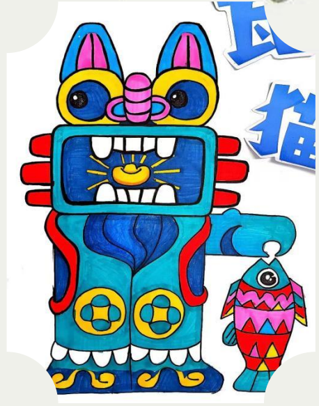
美术红色作品