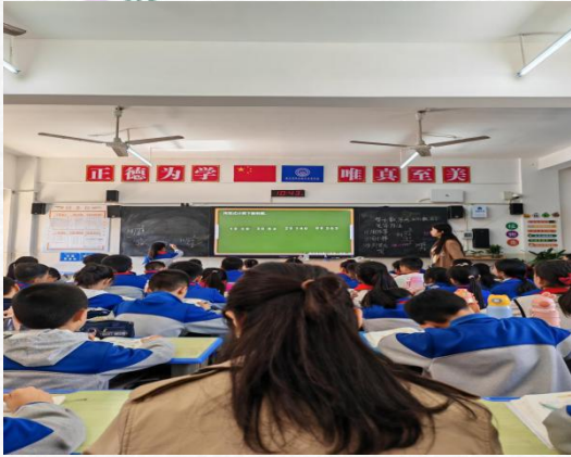
(411班方老师的公开课)