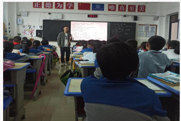
(404班李老师的常规课)

实习生们结合所学专业知 识 ，根据指导教师的建议，对教材进行了深入挖掘和二次开发，设计了符合学生认知规律的 教案 。