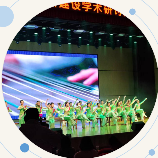
学生综合素质展演