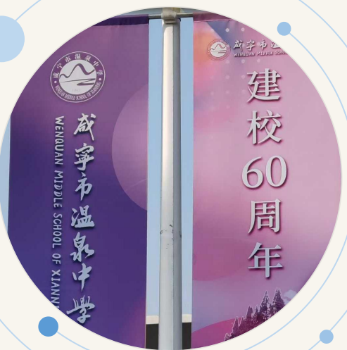
温中六十周年校庆