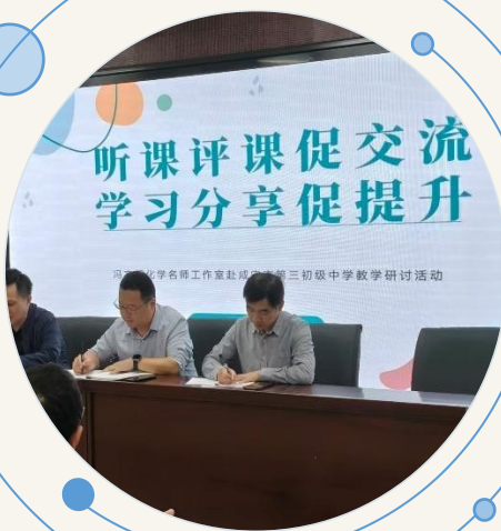
参加教学研讨活动