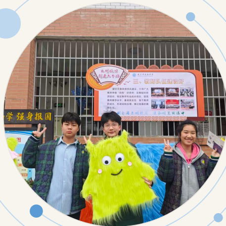
与“毛茸茸小怪兽”合影