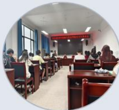
全体实习生参会学习