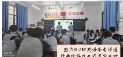
图为902班英语李老师通过趣味游戏来巩固学生对现在完成时态的认识