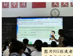
图为905班凌老师在引导学生完成现在完成时态的练习